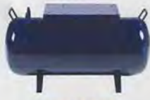
KY-A024 储气罐 (60l) tank (60l)