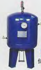
KY-Q01 储气罐 (150l) tank(150l)