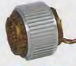
KY-A030 泵头线圈 (840w) motor wire