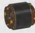
KY-A031 泵头线圈 (545w) motor wire