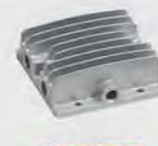
KY-A037 右缸盖 cylinder cover