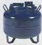
KY-A023 储气罐 (32l) tank (32l)