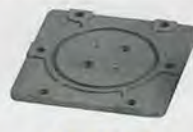
KY-A049 阀板 valve plate