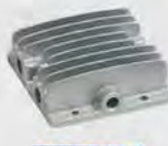
KY-A035 左缸盖 cylinder cover